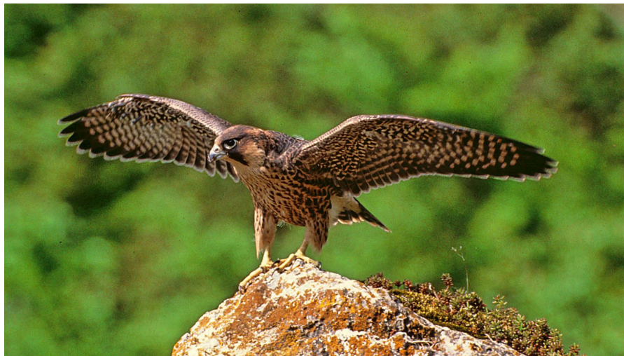
Der elegante Flieger greift seine Beute in atemberaubenden Sturzflug. Hier ein Jungvogel, der diese Jachtechnik wohl erst noch lernen muss.

BirdLife Schweiz hat nun in Zusammenarbeit mit Partnern ein Merkblatt erstellt, wie man vorgehen soll, wenn man einen toten Wanderfalaken oder einen anderen toten Greifvogel findet. Dieses Merkblatt kann unter www.birdlife.ch/wanderfalake heruntergeladen werden. BirdLife Schweiz ruft alle dazu auf, wachsam zu sein und Vorfälle oder einen Verdacht sofort der Polizei und zugleich unbedingt auch BirdLife Schweiz zu