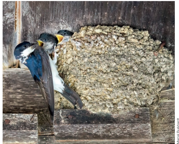
Jungenaufzucht ist Fleissarbeit: Um ein Nest aufzubauen, braucht ein Mehlschwalbenpaar weit über eintausend Mörtelklümpchen.

Ein paar dezidierte Schläge mit einem Besenstil und schon fällt das lästige Nest runter. Mit einer gewissen Befriedigung räumt der neue Einfamilienhausbesitzer die Trümmer und die paar kleinen Eier zusammen. Was hatten diese Vögel sich eigentlich erlaubt? Kaum war das Haus fertig, schon meinten die Mehlschwalben, die frisch verputzte Fassade verkleckern zu müssen. Da wurde Herr Bünzlis Toleranzgrenze zu arg strapaziert!