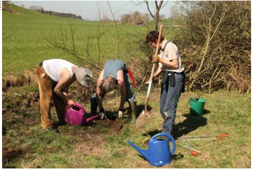
Heckenpflanzung im Herrenwegmoos.