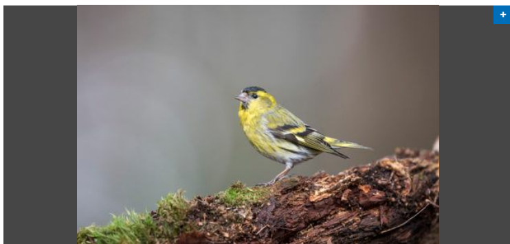
Der Erlenzeisig gehört in manchen Jahren zu den häufigsten Durchzüglern, der am EuroBirdwatch-Wochenende beobachtet wird.