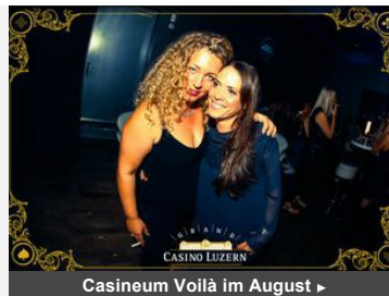
Casineum Voilà im August ▶