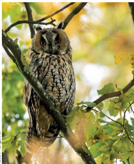
Waldohreule im Tageseinzustand.

Im Kanton Luzern ist die Waldohreule vor allem aus der Wauwilener Ebene bekannt. Aber auch anderenorts gelangen anlässlich der Aufnahmen für den Brutvogelatlas 2013–16 Nachweise. Mittlerweile liegen aus fast allen Atlasquadraten (10 x 10 km-Quadrate), die 1993–96 besetzt waren, Bestätigungen aus