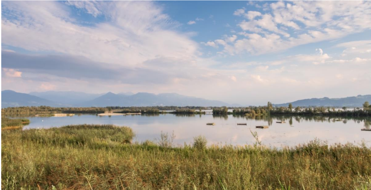
Lagune im Rheindelta