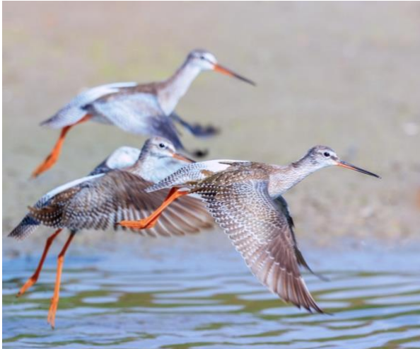
Dunkle Wasserläufer